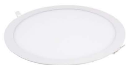
LED PANEL LN12W