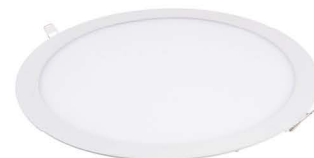
LED PANEL LN24W